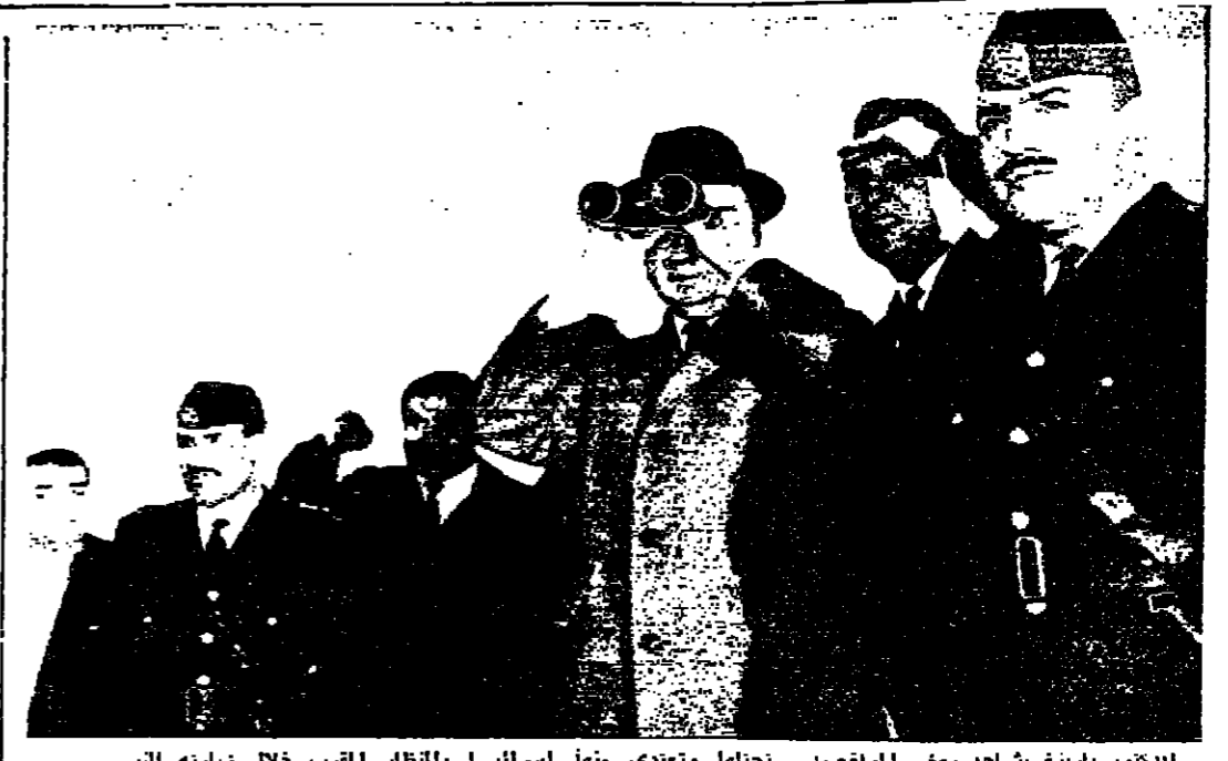
الكتور بارشع يشاهد بعض المرافق على سفينة وتعدى منها إسرائيل بالظفر الغرب خلال زيارته للتبسي موسى أمس